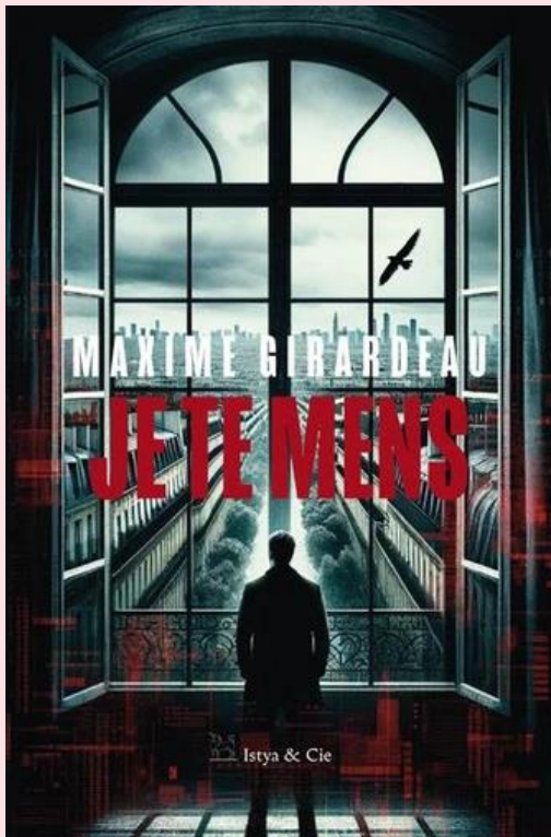
MAXIME GIRARDEAU ISTYA ET CIE - 2024

Loïe est un personnage à part entière qui épaula Max. Ça donne un petit plus à cette histoire. Grâce à ce personnage, l'auteur interroge sur les IA et leur développement dans le futur. C'est un sujet vraiment intéressant !